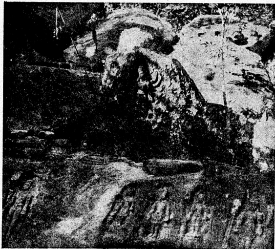
শ্রীহৰ্ণ পাহাৰৰ কেইটামান মূৰ্তি